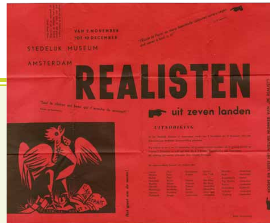
Uitnodiging voor tentoonstelling ‘Realisten uit zeven landen’, Stedelijk Museum Amsterdam, 1951